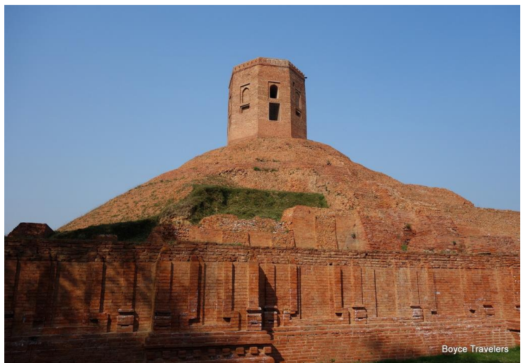
喬堪祇塔（Chaukhandi），又名五比丘迎佛塔，是一座大型的覆鉢型磚塔，是佛陀成道後從菩提迦耶前往鹿野苑，與五比丘相遇之處