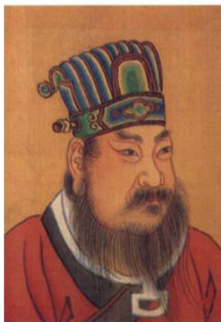
南朝 梁武帝 (464—549) 清人繪

以前有一個寺院，這個寺院分成東西兩房，東房的法師一早起來做早課誦經，可是西房的法師一直遲到。後來有個小沙彌去打聽，知道東房的法師一直都有一條蚯蚓把他們叫醒，他們就可以很準時的起來做早課。有一天，西房的沙彌趁著大家都不在，就跑到東房那邊去，用熱湯倒在蚯蚓穴裏頭，把蚯蚓活活燙死。東房的法師看到之後，就給蚯蚓做超度，這個蚯蚓就投胎轉世做了樵夫。