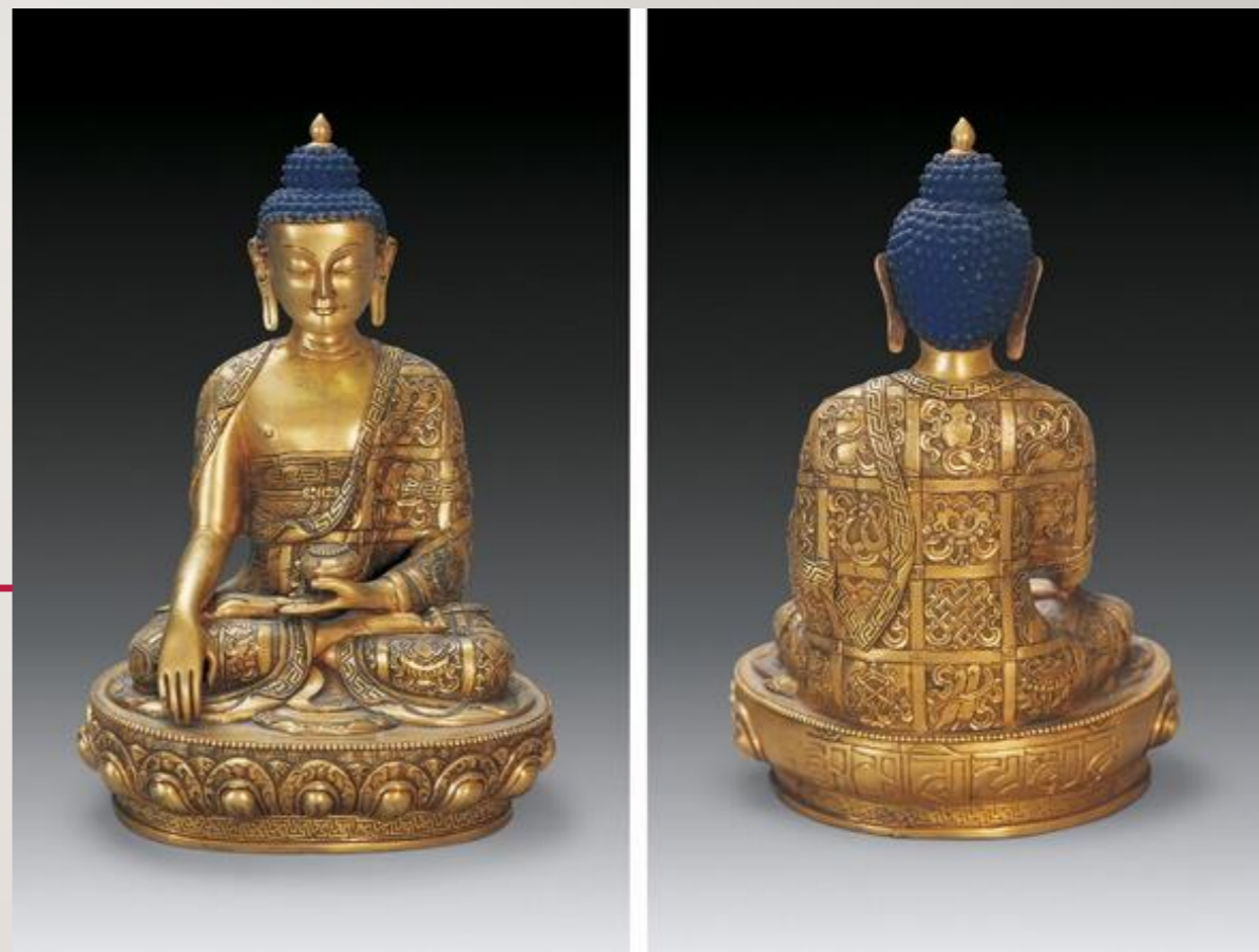
明代鎏金銅「釋迦牟尼佛」 像---紺目澄清四大海

上來奉為求懺。眾等修崇。 慈悲道場懺法。今當第一卷。 功德克諧。圓滿於內。 脩設壇場。鋪舒紺像。 燈然火樹。香噴沉檀。 散五色之名花。獻新奇之妙果 歌揚梵唄。稱讚洪名。 行道入禪。諷經持咒。