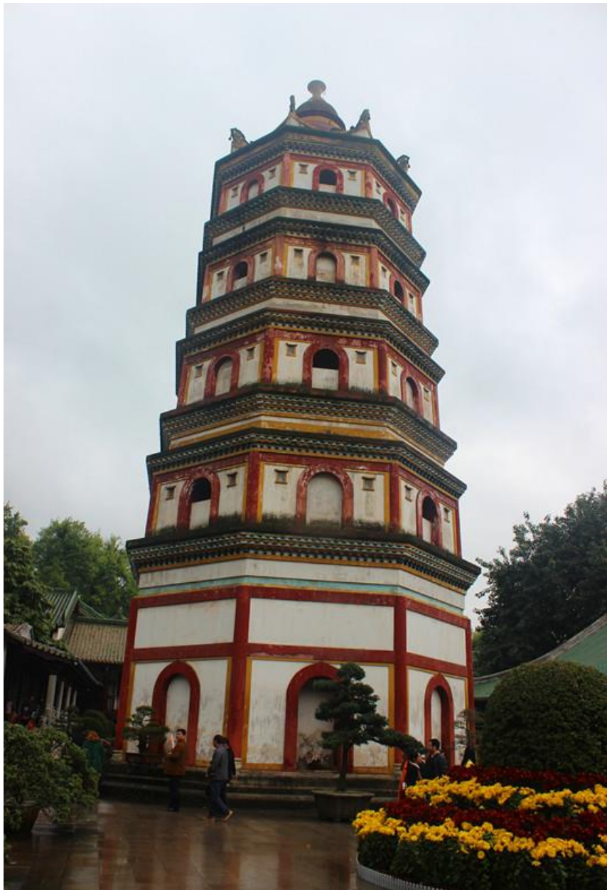
靈照塔—供六祖肉身